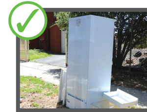
سامان برقی و آهنی