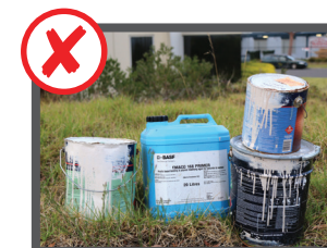
سیلندر گاز، مواد شیمیایی، آفت کش، رنگ و اشغال خطرناک