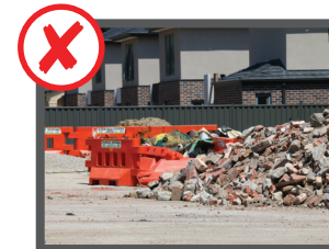
سامان ساختمانی و تعمیری (خشت، سمنت یا آزیستو)