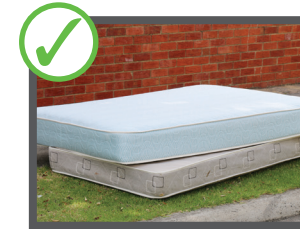
توشک (حداقل 2 دانه)