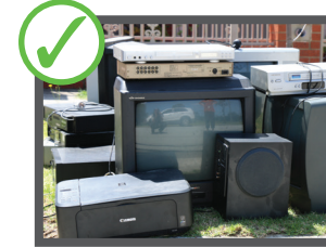
تیلویزیون و کامپیوتر