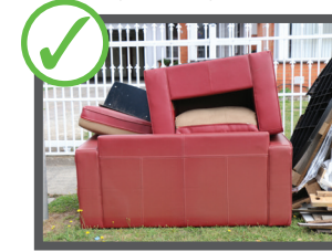
سامان معمولی خانه فرنیچر و دیگه سامان