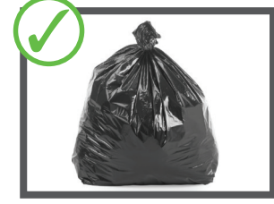
اشغال عمومی خو د خلته اندزکین