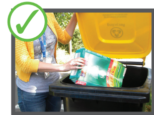
سامان ره د بین اشغال دانی بازیافت شوندی خو واز بیلین