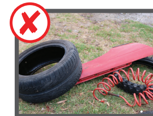
بخشای موتور، تایر، باطری و بخش اینجن