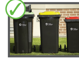
دان خلته اشغال خو بسته کین تیت نشونه