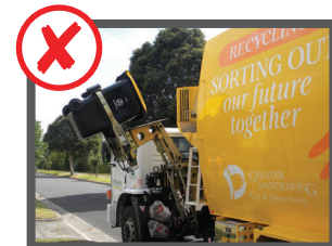
عذر گرناک باشه (بیشتر از 80 کیلو)

اگر سطل اشغال از شمو جمع نشد یک خط د بيله شی ایشته موشه که مشکل ره بوگیه که ای پیش از دغه دنگه که اشغال ره جمع کنی باید صیه شونه.