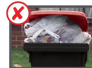
عذر پور باشه (سرپوش شی بسته نشونه)