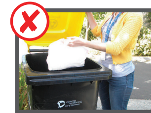
خلته پلاستیکی ره د بین سطل اشغال بازیافت شوندی خو نیلین