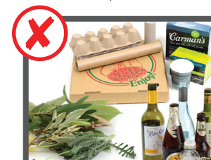
اشغال خانه، سامان بازیافت شوندی، اشغال حویلی