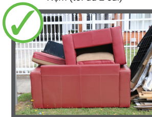
Bàn ghế tử gia đình thông thường và các mặt hàng khác