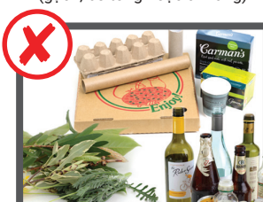
Rác gia đình, sản phẩm tái chế, vườn tược