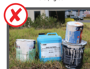
Bình ga, hóa chất, thuốc trừ sâu, sơn và rác thải độc hại