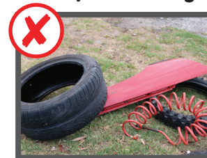
Phụ tùng xe hơi, bánh xe, bình điện và động cơ