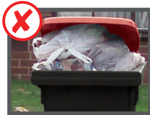
Quá đầy (không đóng nắp lại được)