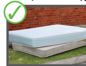
Nệm (tối đa 2 cái)