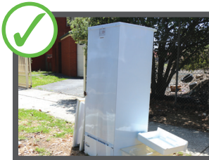
Đồ điện máy và kim loại