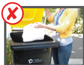
Đừng bỏ túi nilông vào thùng rác tái chế