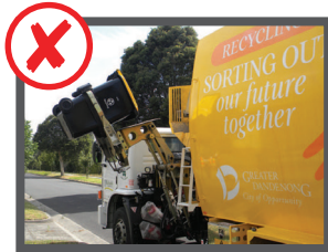
Quá nặng (80+kg)