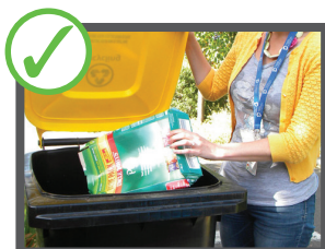
Bỏ rác thải rời nhau vào thùng rác tái chế