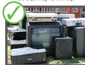
Ti vi và máy vi tính