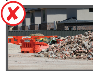
Vật liệu xây dựng và tân trang (gạch, bê-tông hoặc amiăng)