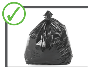
Mettete i rifiuti generici nei sacchetti