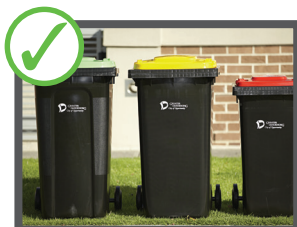
Chiudete il coperchio del bidone per evitare che fuoriescano e sporchino