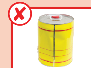
Niente vernice, olio o liquidi