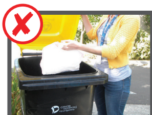
Non mettete sacchetti di plastica nel bidone del riciclaggio