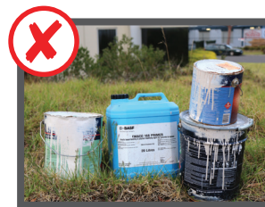
Bombole di gas, prodotti chimici, pesticidi, vernici e rifiuti pericolosi