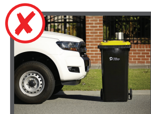
Vicino a macchine parcheggiate