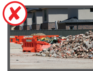
Materiali da costruzione e ristrutturazione (mattoni, cemento o amianto)