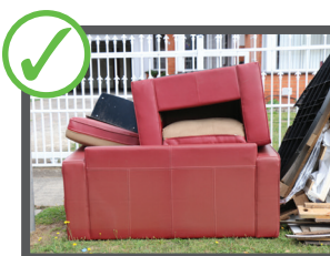
Mobili domestici generici e altri articoli