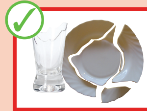
Ceramica e vetri rotti