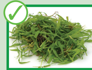
Ritagli d'erba ed erbacce

Assicuratevi che i rifiuti del vostro giardino siano privi di terra