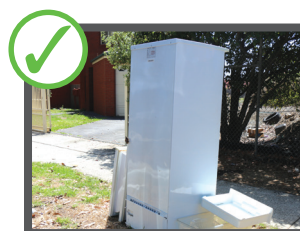
Elettrodomestici e metallici