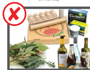
Rifiuti domestici, prodotti di riciclaggio, rifiuti da giardino