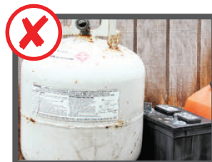
Riempito di oggetti incorretti