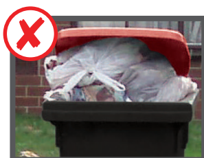
Strabordante (il coperchio non si chiude)