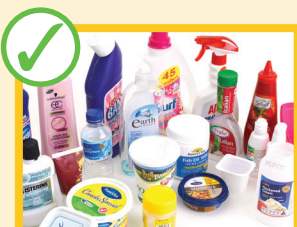
Bottiglie e contenitori di plastica vuoti