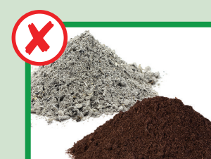
Niente macerie, terra o cenere