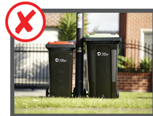
Vicino ai pali e ai fili della luce