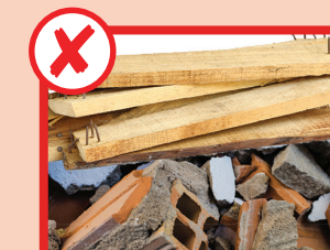
Niente legno e materiali da costruzione

Volete sapere il vostro giorno di raccolta? Visitate greaterdandenong.vic.gov.au/waste oppure chiamate il numero 8571 1000