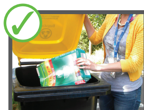
Mettete i materiali sciolti nel bidone del riciclaggio