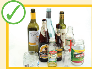
Bottiglie e barattoli di vetro vuoti