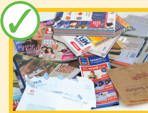
Giornali, riviste, carte, buste, lettere, elenchi telefonici e cataloghi