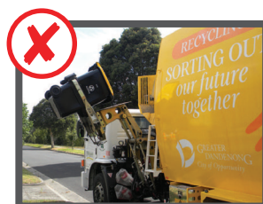
Troppo pesante (80+kg)