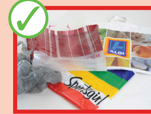
Sacchetti e confezioni di plastica