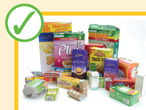
Scatole di cartone