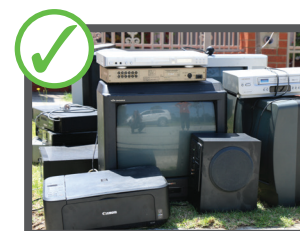
Televisioni e computer