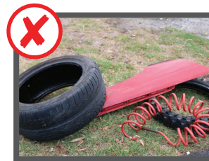
Parti di automobile, pneumatici, batterie e pezzi di motore