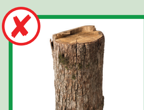
Niente tronchi o ceppi