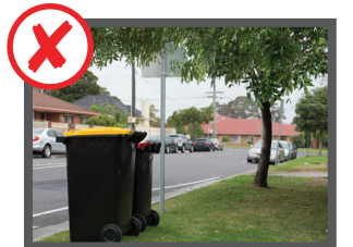
Sotto grandi alberi o rami