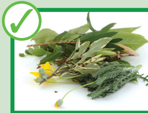
Foglie e potature da giardino