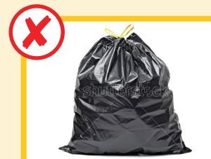
Niente rifiuti generici