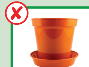
Niente vasi di piante