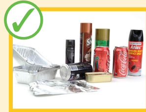
Vassoi di alluminio puliti, alluminio vuoto, acciaio e bombolette spray

Non riempite eccessivamente i bidoni e mettete sfusi i materiali di riciclaggio