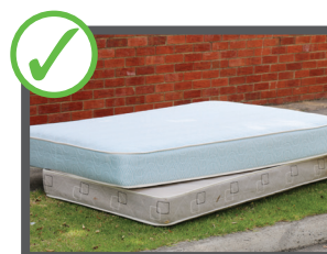
Materassi (massimo 2)