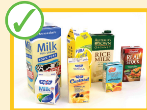
Confezioni di latte e di succhi