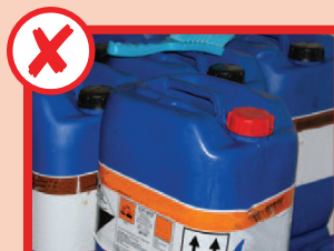
Niente agenti chimici pericolosi