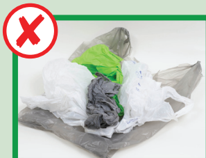
Niente sacchetti di plastica