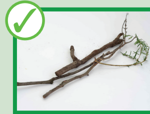
Piccoli rami. Dimensioni per rami 10 cm x 30 cm