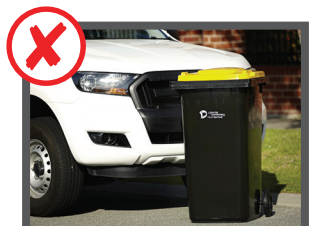
In strada, sul marciapiede o sul vialetto di casa