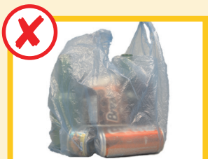
Non mettete oggetti riciclabili nei sacchetti